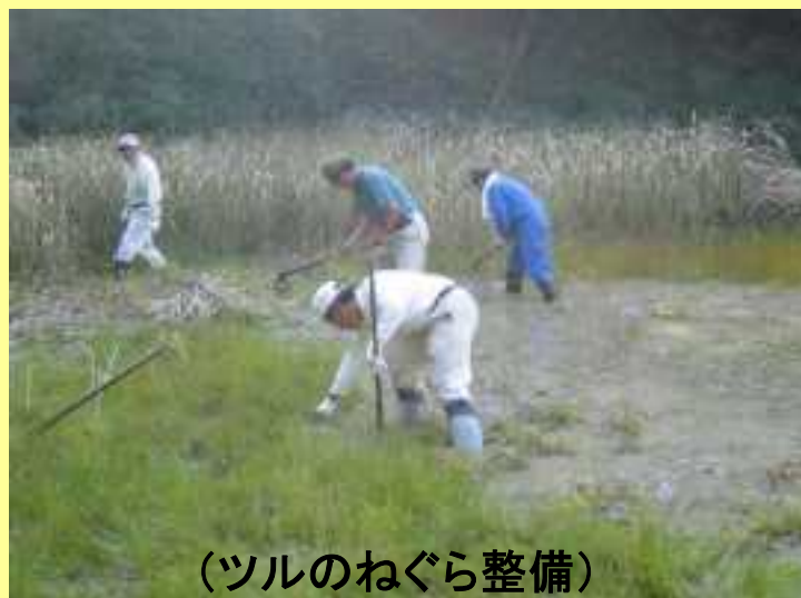
(ツルのねぐら整備)