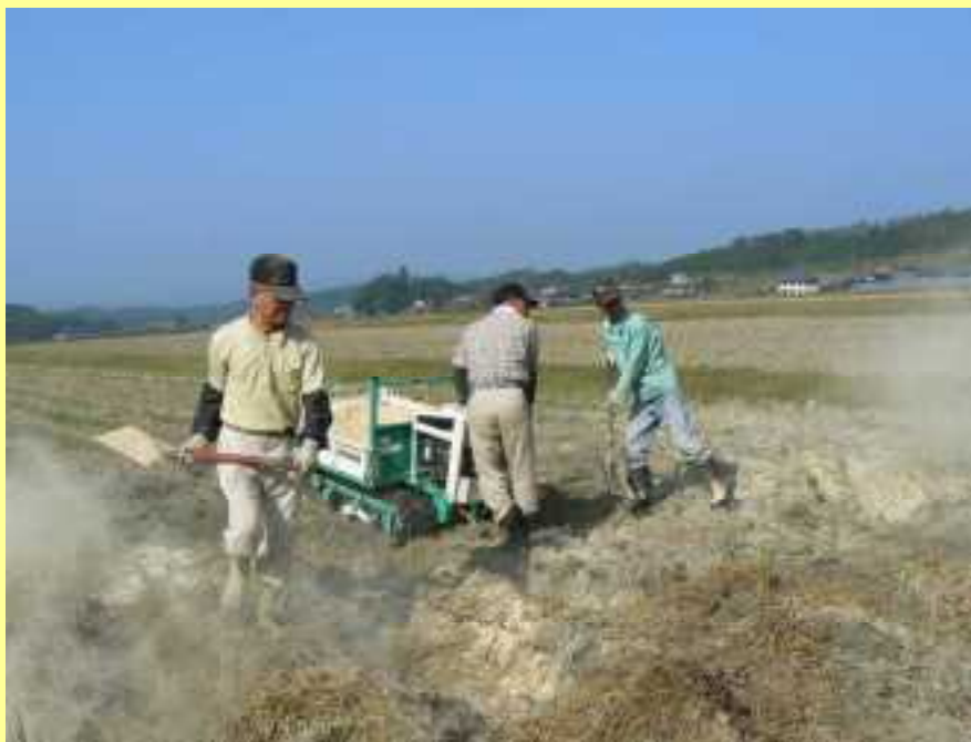
冬期湛水のぬか撒き