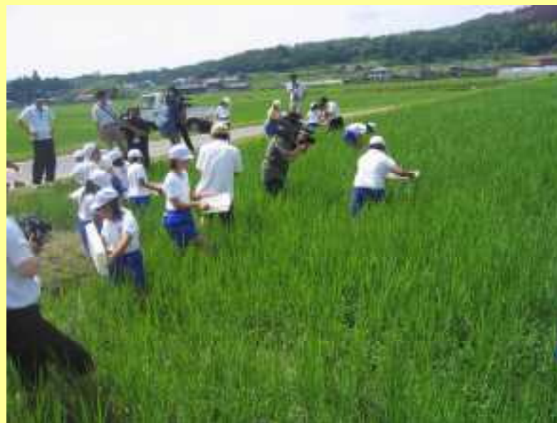
(小学生によるドジョウの放流)