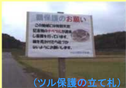
(ツル保護の立て札)