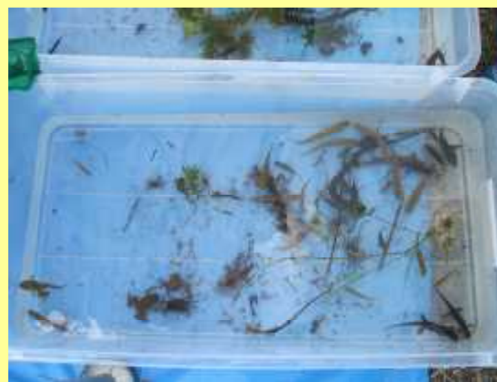
「水辺の教室」の生物観察状況