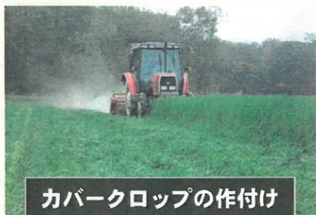
カバークロップの作付け