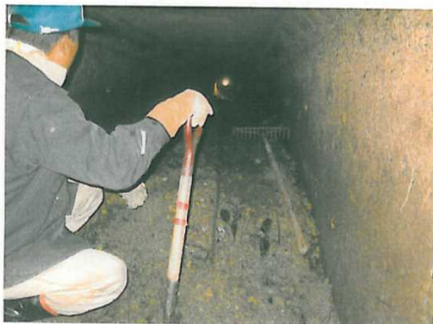
サイホン式水路の泥上げ

忘れかけていた共同作業が活性化し、地域の連帯感や農地や施設への保全活動が一層深まってきました。