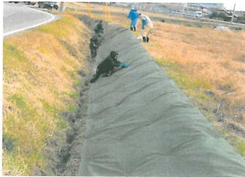
抑草シートの設置

雑草繁茂を抑制するとともに除草作業の軽減が図られるよう農地法面に抑草シートを設置するとともに、連歌川にホタルや魚等の水生生物の生息場所(ベンチフリューム)を設置した。また、遊休農用地へ「花蓮」を植栽して訪れる人々を楽しませている。