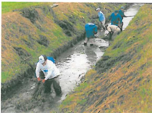
連歌川の一斉清掃 オオカナダ藻の除去(外来種)

かけがえのない豊かな自然に恵まれたこの地域を次世代に継承するために、多くの非農業者とともに外来種の駆除や景観植物の植栽をしました。