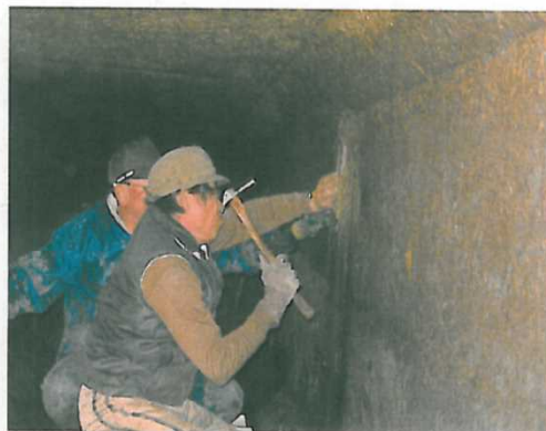
サイホン式水路の破損部分の補修