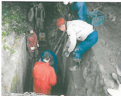
ウインチ操作による泥上げ

これまでは、破損部分の補修等については行政に頼りきっていましたが、今は、施設の長寿命化につながる保全活動を自主施工しています。