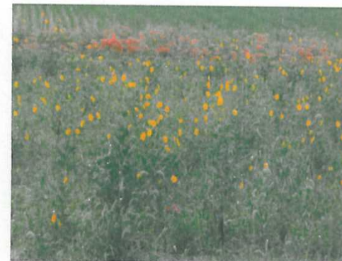
景観形成のための施設への植栽(コスモス)