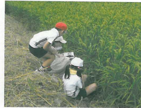
田んぼ周辺の生き物調査