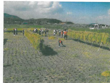
はぜかけ(出来上がり)