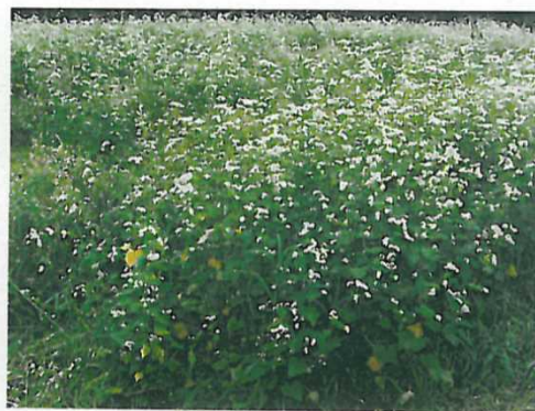
景観形成のための施設への植栽(そば)