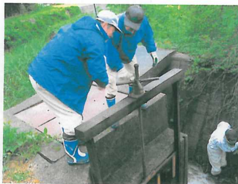
ゲートの保守管理