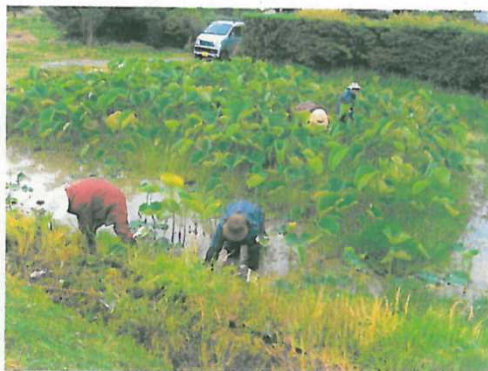
施設等の定期的な巡回点検(花蓮)