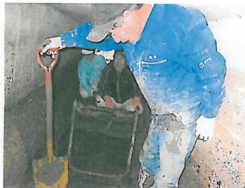
随道内の汚泥の撤去作業