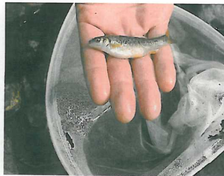
生物の生息状況の把握(うぐい)