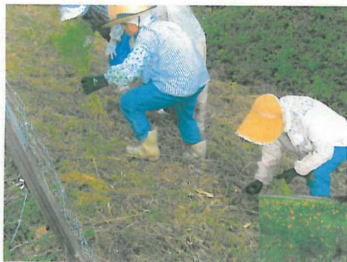
景観形成のための施設への植栽(コスモス)