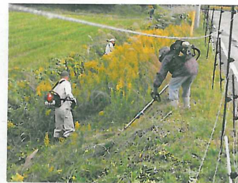
セイタカアワダチ草の駆除(外来種)