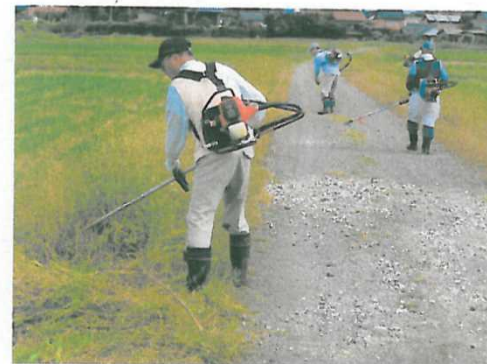
農道の路肩法面の草刈