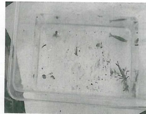
田んぼ周辺の生き物調査(かわえび等)