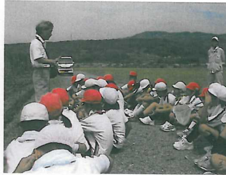
生物の生息状況の把握