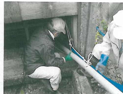
サイホン水路の水抜き作業