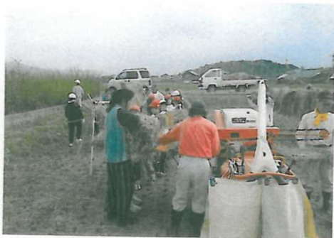
コンバインによる脱穀

学校教育との連携により、NPOや棚田数え唄の会のメンバーが中心となって、田植え、稲刈り、生態系の調査等を行い次世代を担う子供たちに農業や生命の尊さ・自然の摂理を教えています。