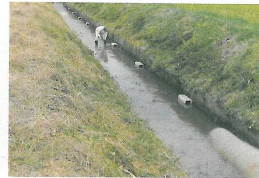
連歌川への魚類等の生息場所の設置