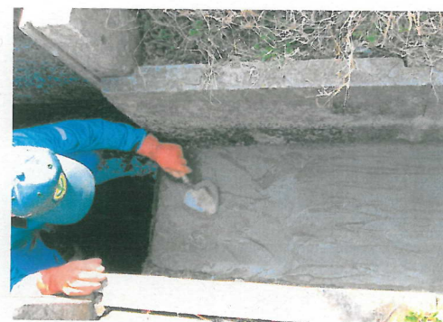
表面劣化に対するコーティング