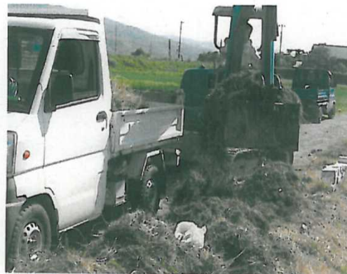
水路より除去した藻等の収集