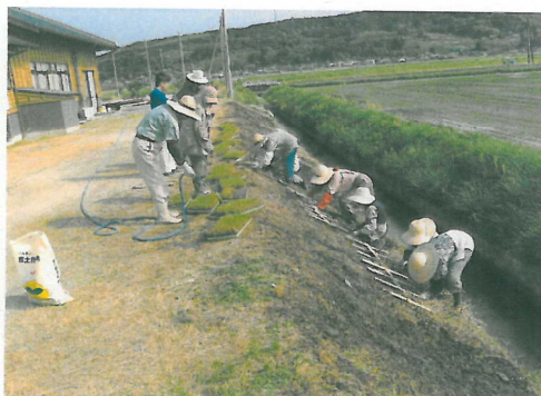
カバープランツ(ティフ・ブレア)の植栽