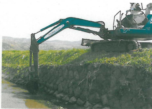
水路に付着した藻等の除去