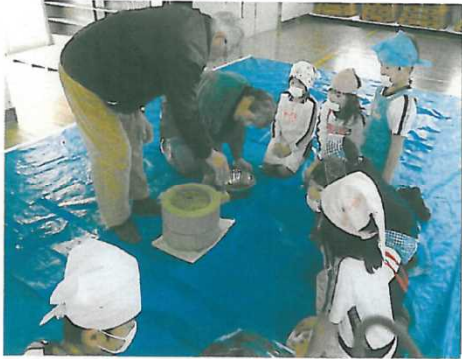
石臼によるきな粉づくり

学校教育との連携により、NPOや棚田数え唄の会のメンバーが中心となって、田植え、稲刈り、生態系の調査等を行い次世代を担う子供たちに農業や生命の尊さ・自然の摂理を教えています。