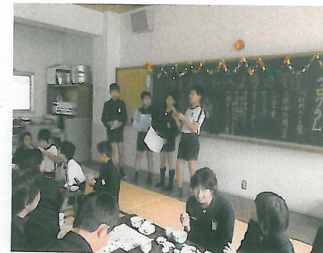
ライスパーティーの開催(H22)