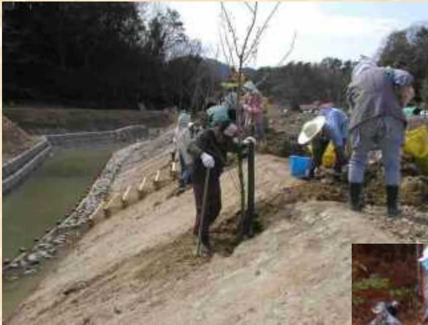
ビオトープ周辺への植樹 （桜、柳）