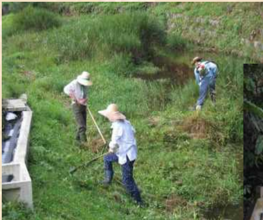
花が迫ビオトープ