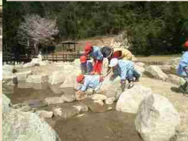
湿地型ビオトープ(親水型)