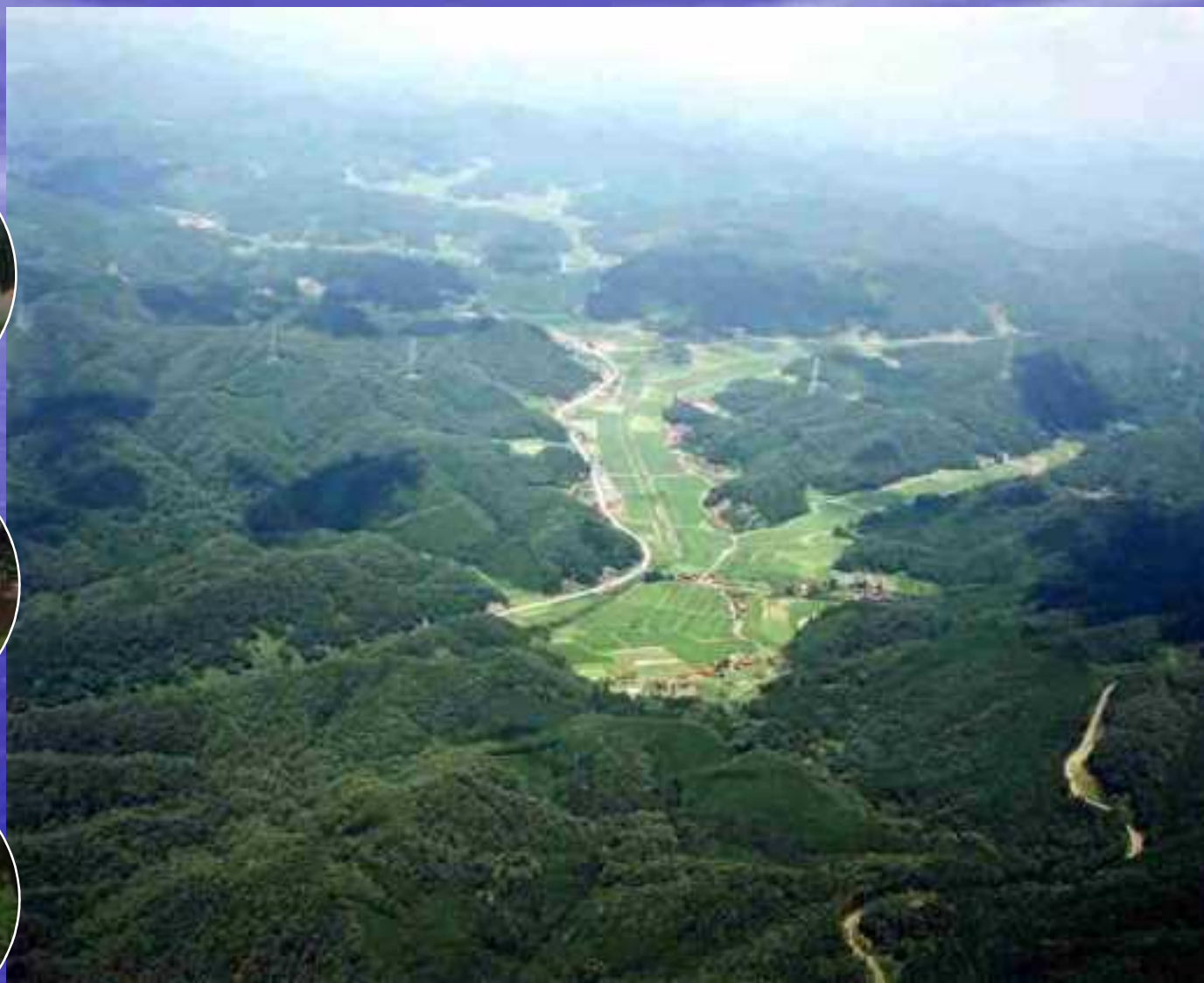
▲ 十種ヶ峰から見た嘉年集落