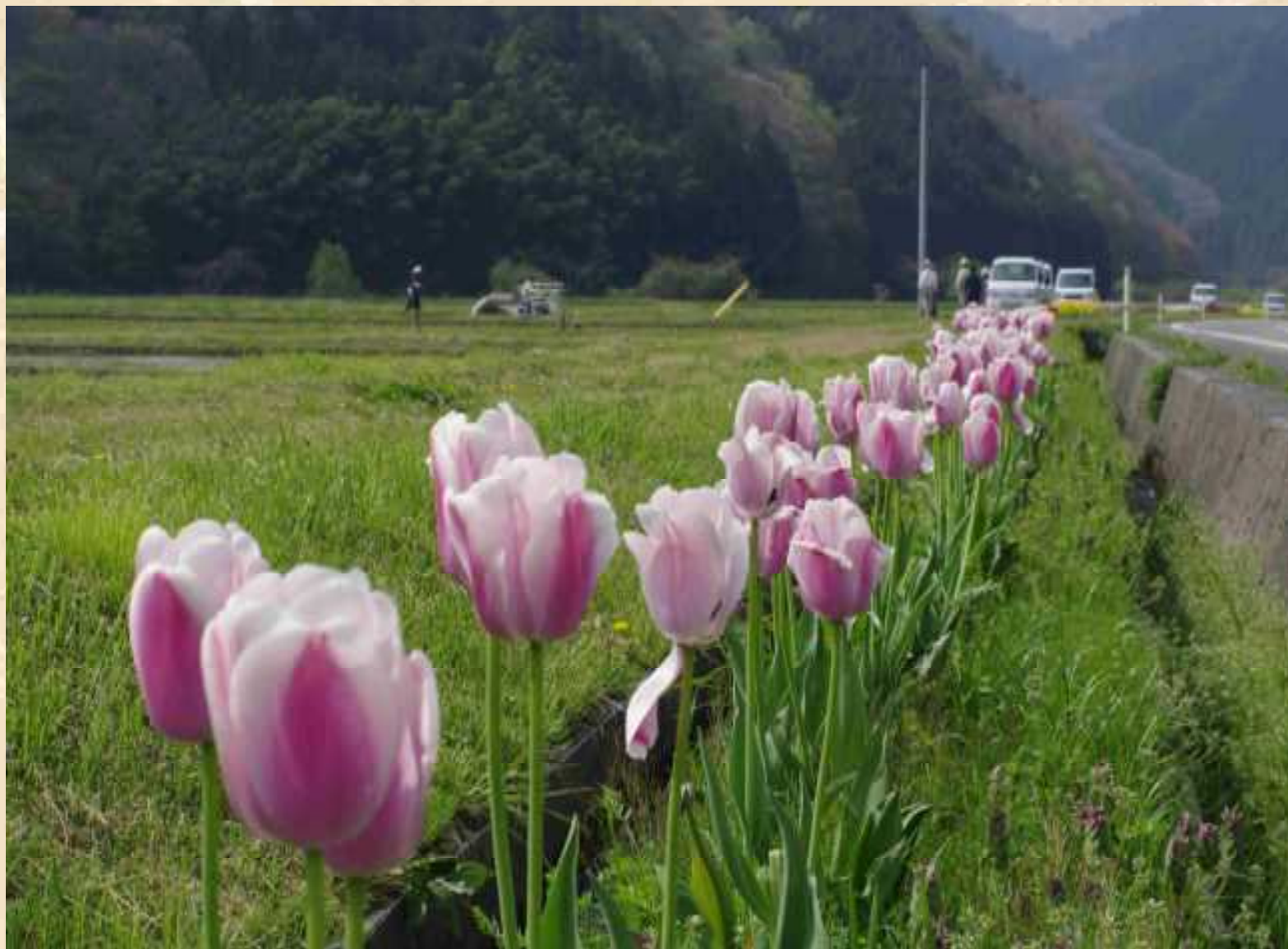
広報あとうの表紙を飾ったチューリップ