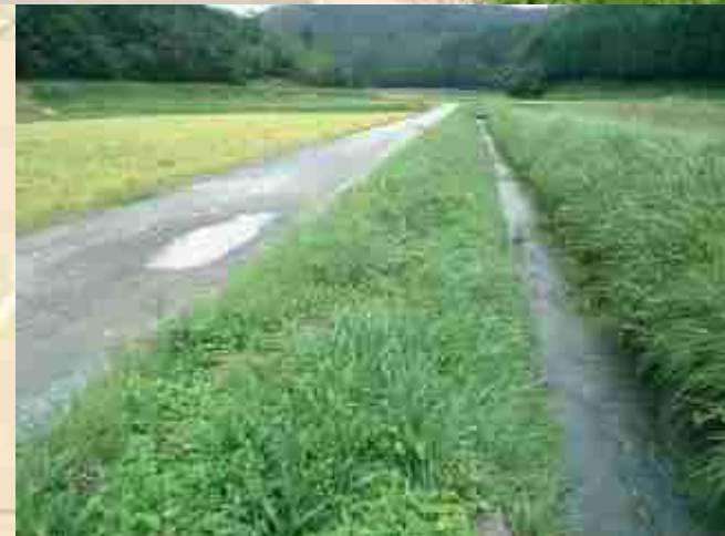
水源池下流の河川(土水路部)