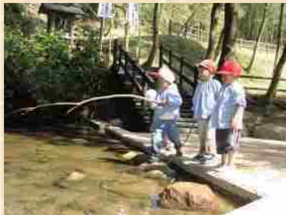
「水出の泉」水源池 と 水神様(階段奥)