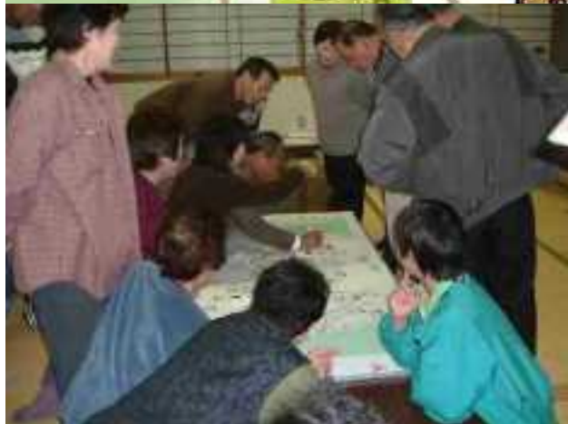
◀ 夢マップの検討作業