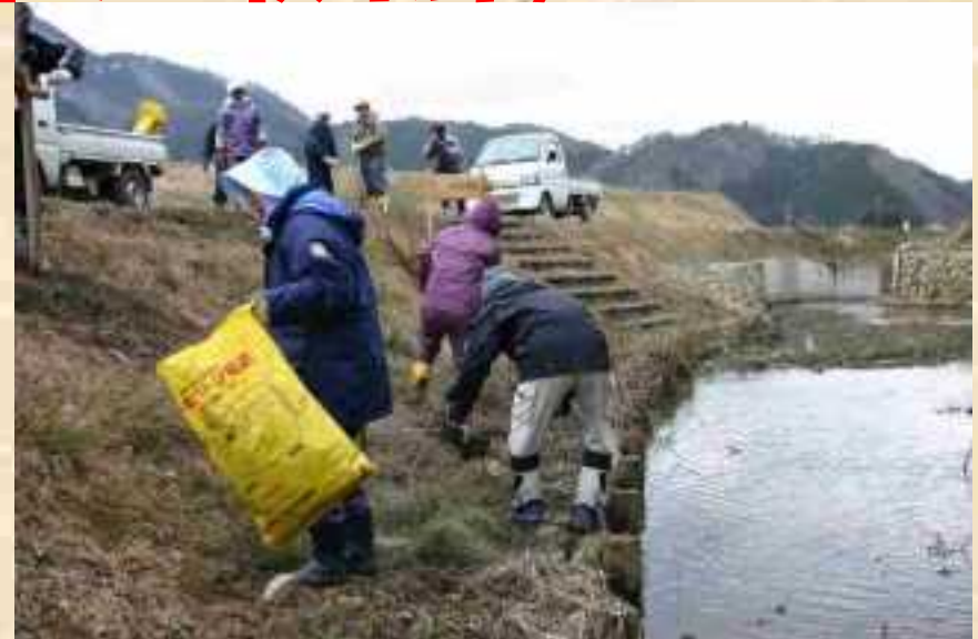
ビオトープの草刈り・清掃